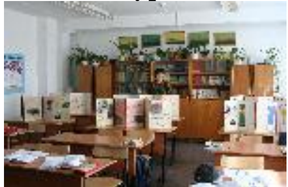
Кабинет бурят. языка