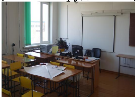
Кабинет технологии (комп. оборудование)