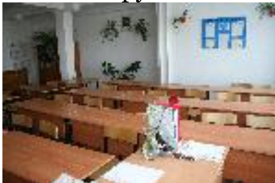
Кабинет русск. языка