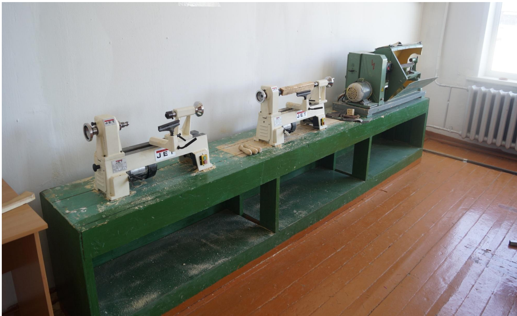
Оборудование для кабинета технологии