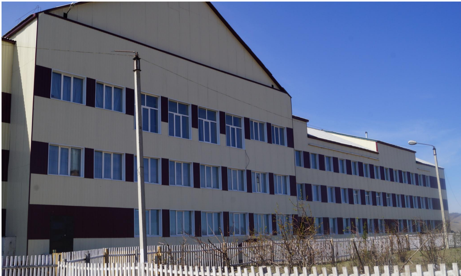
Капитальный ремонт фасада школы