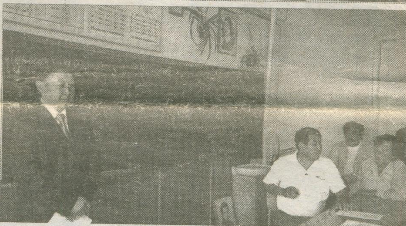
На переговорной площадке большую активность проявили главы поселений, родители, попечительский совет.

ковская, Сужинская и Гильбиринские средние школы.